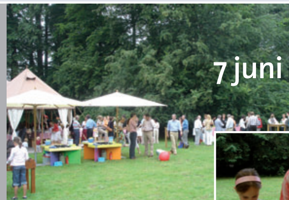
Salon Picknick op landgoed Hilverbeek in 2007

Nee, veel belangrijker is het gevoel iets te kunnen betekenen voor het Koninklijk Concertgebouworkest. „Ik vind het normaal dat bepaalde groepen in de samenleving iets voor dergelijke instellingen doen. Ik denk dat ze niet meer zonder deze hulp kunnen. Helemaal goed is het om als een groep betrokken te worden. Als er een gezamenlijke basis ontstaat ben je altijd bereid om meer te doen. Bij de Salon gebeurt dat. Er zijn interessante bijeenkomsten, je ontmoet inspirerende mensen. Zo snijdt het mes aan twee kanten; we helpen het orkest en ook Stek heeft er nog iets aan.”